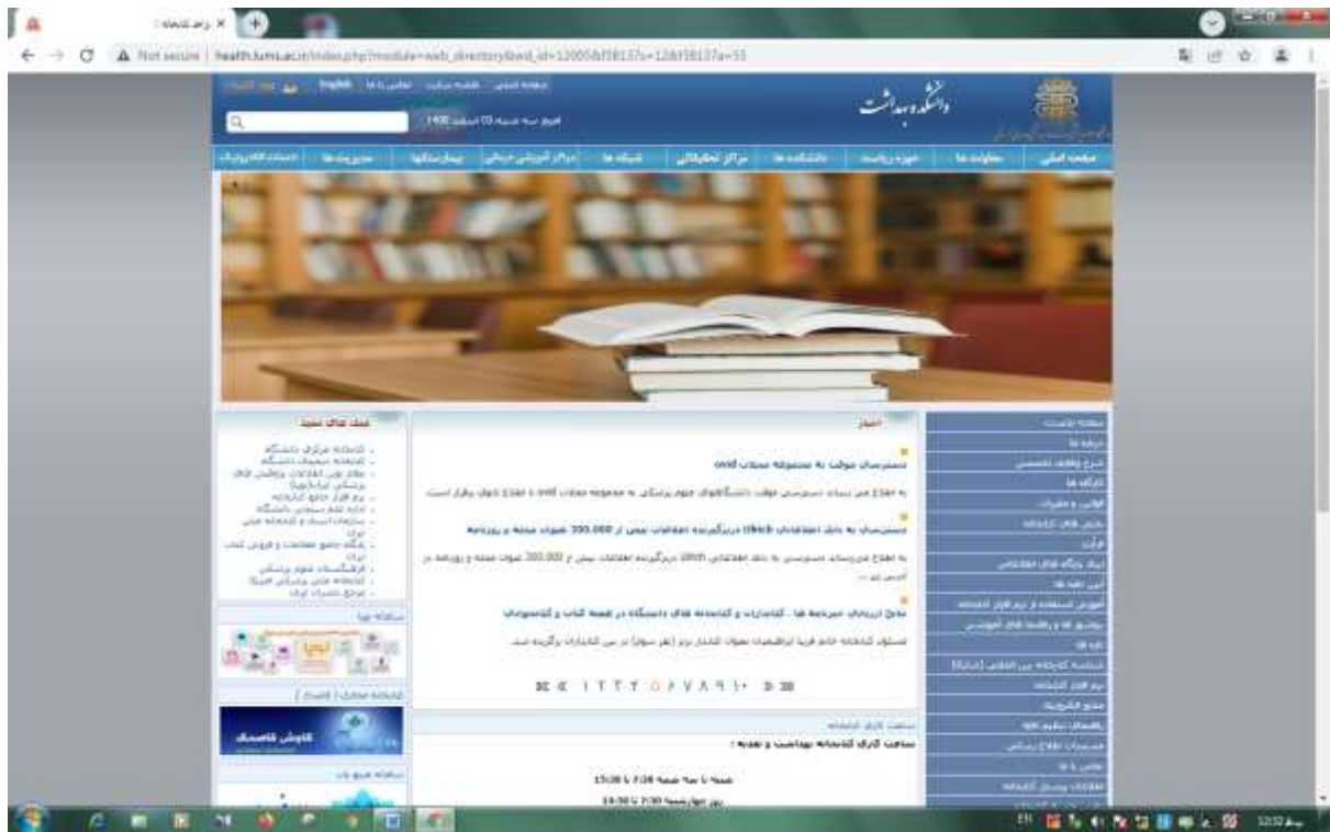
کتابهای و جینی :